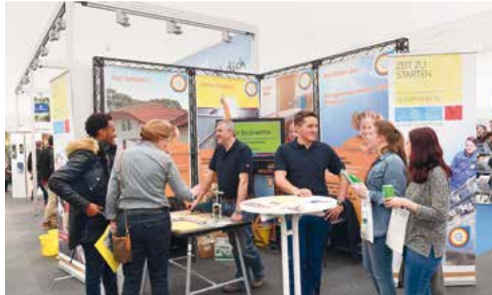
Drei Tage stehen die Experten an den Messeständen und im Forum persönlich Rede und Antwort!

Jobs for Future – der Hotspot für Arbeitsplätze, Aus- und Weiterbildung! Hier sind sie alle dabei: Familienunternehmen und Weltkonzerne, Hochschulen, Akademien, Schulen, Handwerkskammer, Agentur für Arbeit, IHK, Polizei, Bundeswehr, öffentlicher Dienst, Verbände, Regionalbüro für berufliche Fortbildung sowie Institutionen für Gastronomie, Gesundheit und Soziales.